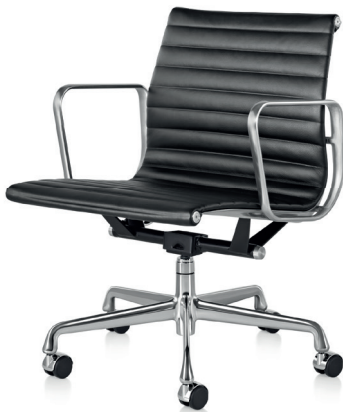
The lithe chairs of the Eames Aluminum Group, 1958

Tous ces matériaux ont été explorés par des techniques de fabrication innovantes. Le processus de moulage du contreplaqué consistait à cintrer de fines couches de bois sous pression pour créer des formes courbes complexes. Le moulage par injection de plastique, un procédé qui permet de produire des pièces en série de manière efficace.