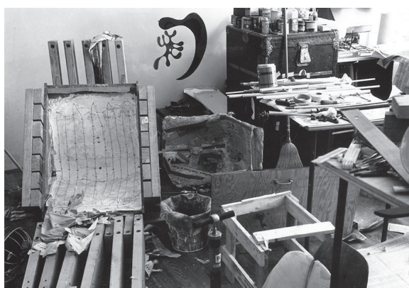
Premier Prototype de la machine Kazam en 1941

à l'Académie des Arts de Cranbrook de Michigan en 1938. Il y devient rapidement professeur de design industriel, puis responsable du département de design industriel en 1940. C'est à Cranbrook qu'il rencontre Ray Kaiser. Eames et Kaiser se marient en 1941 et s'installent à Los Angeles où ils commencent à expérimenter ensemble les techniques de moulage tridimensionnel du contreplaqué. Dans leur appartement, le couple développe la « Kazam Machine » 5 . Après la Seconde Guerre mondiale, les Eames s'installent à un appartement à Washington, qui deviendra le Eames Office.