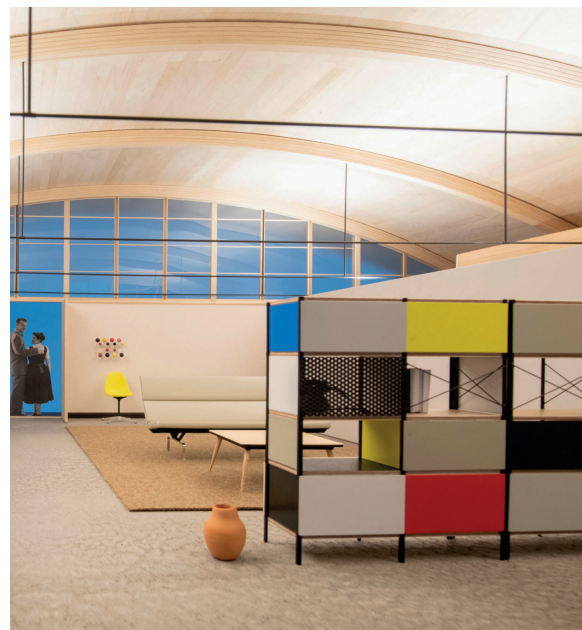
EAMES STORAGE UNITS (ESU), 1950

On peut donc dire que l'héritage du Bauhaus dans le design de Charles Eames se manifeste à travers une variété de principes fondamentaux tels que la fonctionnalité, la simplicité, l'intégration des arts et de l'industrie, la démocratisation du design, et un engagement envers la modernité. Cette influence a contribué à définir le style et l'approche distinctive du couple Eames dans le monde du design moderne.