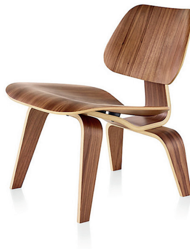
The LCW (Lounge Chair Wood) , 1945

Charles Eames était un pionnier dans l'utilisation de nouveaux matériaux et processus de fabrication dans le design. Il a exploré l'utilisation de matériaux modernes tels que le contreplaqué Moulé qui était l'une des signatures de son travail. Une autre matière qu'utilisait Charles était le plastique renforcé de fibres de verre, c'est un matériau qui offrait des possibilités de formes et de couleurs novatrices. Dans des environnements de bureau, Eames réalisa des sièges en aluminium moulé, des sièges légers, durables et élégants. Finalement, pour rajouter une touche luxueuse et du confort supplémentaire à ses créations, Charles Eames utilisait du cuir de haute qualité pour les assises.