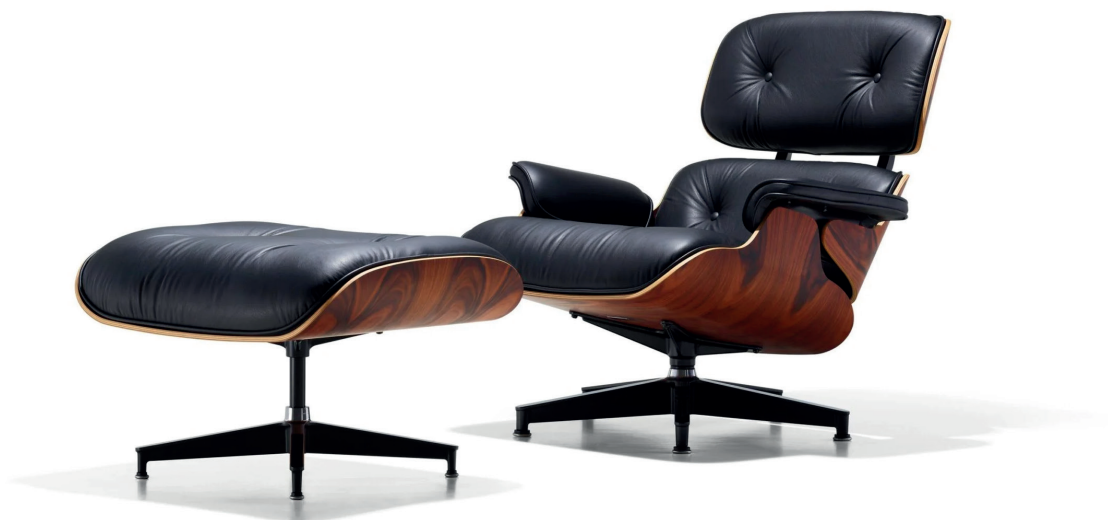
Lounge chair and ottoman, 1956