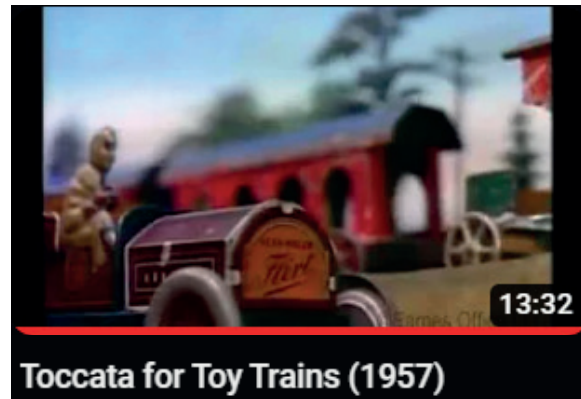
Film réalisé par Ray et Charles Eames en 1957

À une époque où les technologies numériques étaient limitées, Charles et Ray ont créé plus de 125 courts métrages pour expliquer des idées et des histoires complexes. Des œuvres cinématographiques, qui traitent des sujets liés au mobilier, à la science, à l'environnement, aux mathématiques, à l'art, à la technologie et aux modes de vie de différentes nationalités.