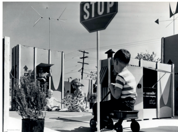
Carton City, 1951